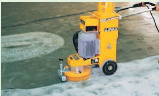
強化コンクリートの目荒し