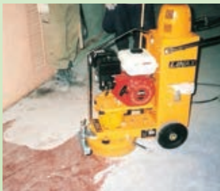
ウレタン塗膜の除去

集じん機搭載型のため、ホコリを出さない快適な作業を実現します。ダストボックスへの袋セットで、ゴミ捨ての手間を大幅に削減。