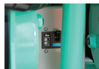
② ブレーカースイッチ